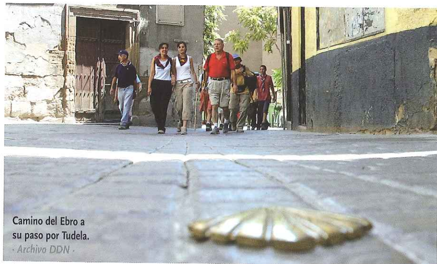
Camino del Ebro a su paso por Tudela.

EL RÍO EBRO HA ACTUADO DE GUÍA PARA LOS PEREGRINOS QUE DESDE LA ZONA MEDITERRÁNEA CRUZAN POR NAVARRA. EL CAMINO JACOBEO DEL EBRO ES UNO DE LOS REFERENTES HISTÓRICOS Y QUE CADA VEZ RECIBE MÁS VISITAS.